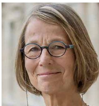
Françoise Nyssen (Ministre de la Culture)