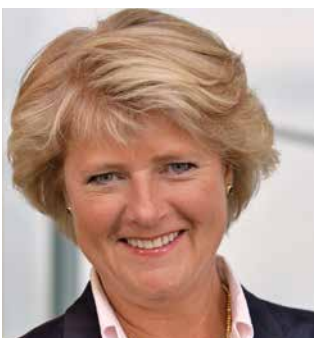
Monika Grütters (Déléguée du gouvernement fédéral à la Culture et aux Médias)

Le 1 er Juin 2018 le prix sera remis à Paris dans les salons du Ministère de la Culture par Françoise Nyssen, Ministre française de la Culture, et Monika Grütters, Déléguée du gouvernement fédéral à la Culture et aux Médias.